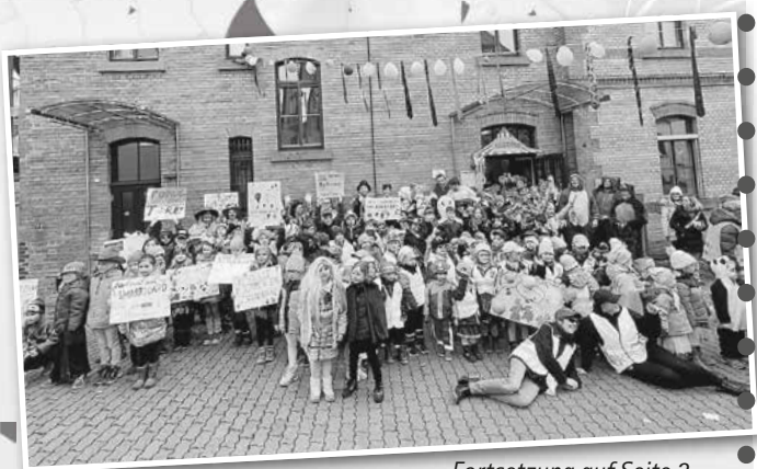
- Fortsetzung auf Seite 2 -