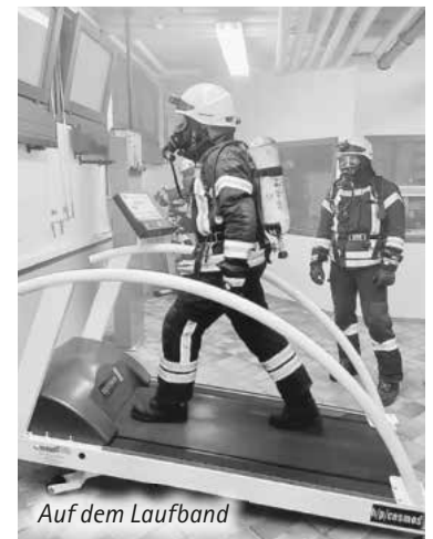
Auf dem Laufband