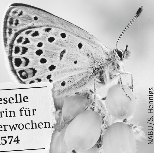
NABU / S. Hennigs

Beflügelter Junggeselle sucht zarte Partnerin für romantische Flatterwochen. Tel.: 030.284984-1574