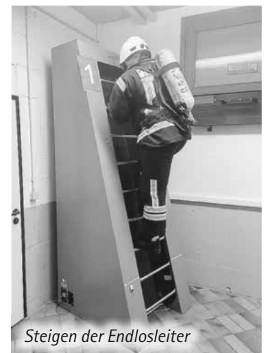
Steigen der Endlosleiter

mögen gefragt waren. Zum Abschluss der Belastungsübungen wurde der Ergometer genutzt, um die Beinmuskulatur und die allgemeine körperliche Fitness zu testen.