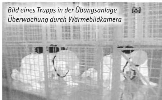
Bild eines Trupps in der Übungsanlage Überwachung durch Wärmebildkamera

Eine weitere Herausforderung war das Hammerzählen, bei dem Kraft und Durchhaltever-