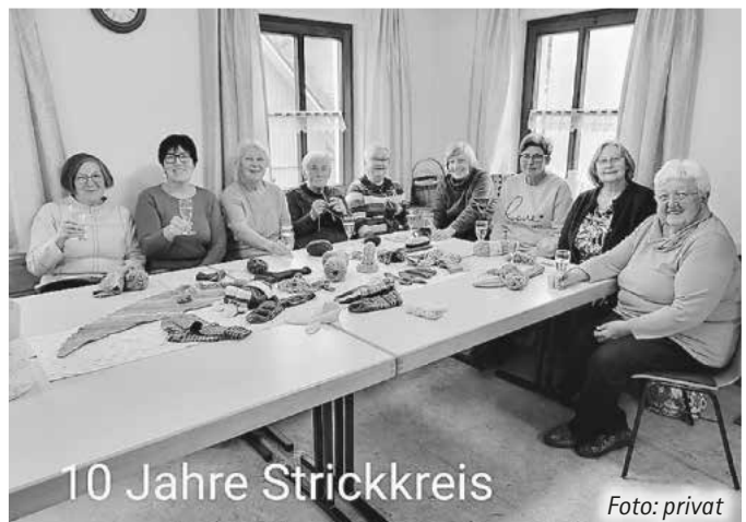
10 Jahre Strickkreis